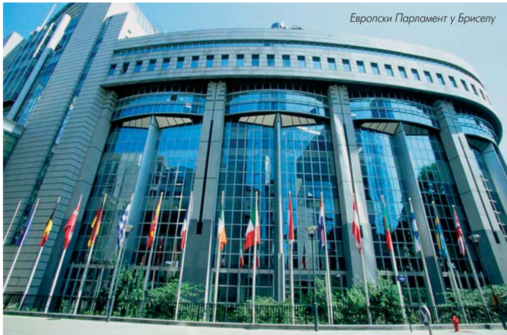
Европски Парламент у Бриселу

потребу успостављања уговорног односа са земљама западног Балкана (и са онима које имају закључен овакав уговор, и са онима које га још немају), али и држава које су кандидати за чланство Уније, пре свега у домену јачања трговинских односа. Предмет преговора био је само рок у коме ће започети преговори за закључење тих уговора (конвенција). Политички дијалог, чији је циљ поступно приближавање СЦГ Европској унији, појачана конвергенција ставова о питањима у међународним односима, регионална сарадња и заједнички ставови о безбедности и стабилности у Европи, остварује се преко три органа, чије су генералне надлежности дефинисане овом приликом, а сва остала питања биће предмет каснијих рунди преговора. Тако је усаглашено да ће се установити Савет за стабилизацију и придруживање (у оквиру кога се остварује политички дијалог на највишем нивоу), Комитет за стабилизацију и придруживање (који прати ток усклађивања права и имплементације Споразума), те Парламентарни комитет стабилизације и придруживања (форум парламентарца обе уговорне стране).