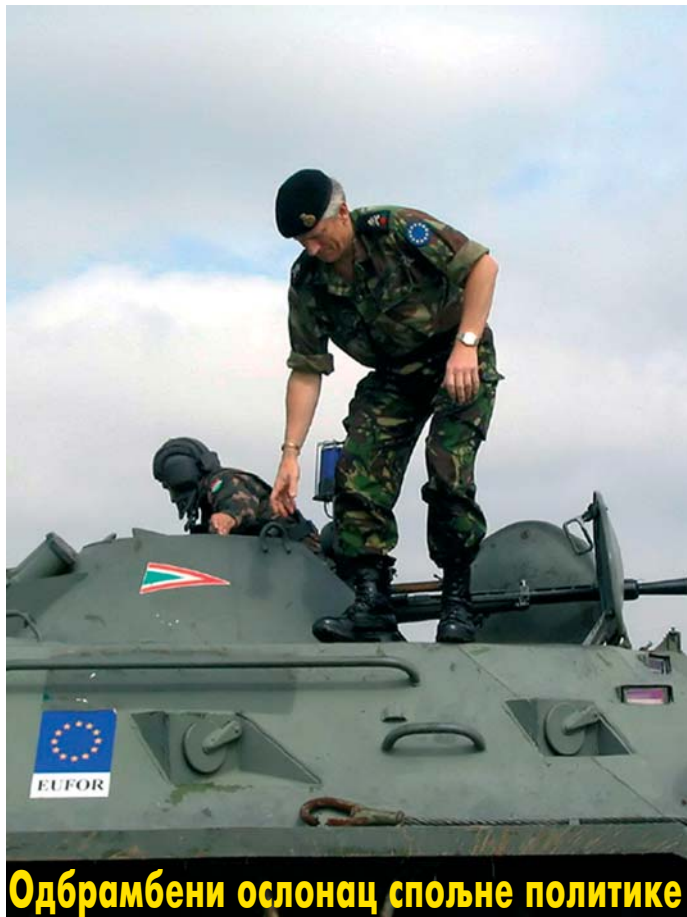
Одбрамбени ослонац спољне политике